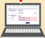
電子申請 専用サイト