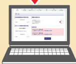
電子申請 専用サイト