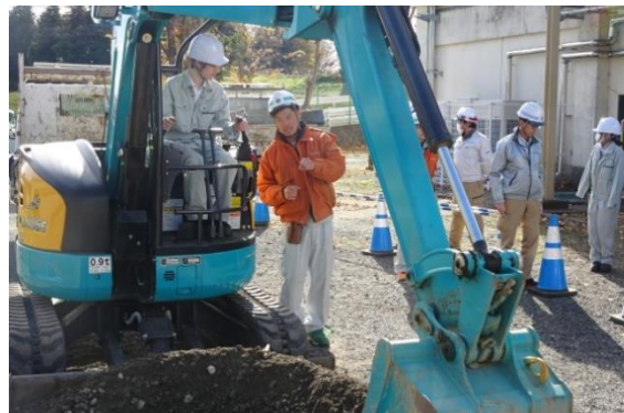
企業によるデモンストレーションのあとは実際に操作体験を実施