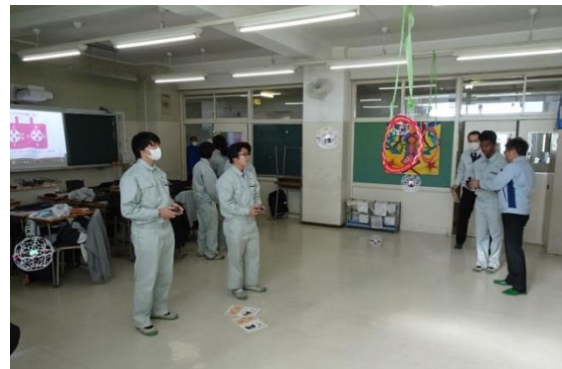
トイドローンの操作体験