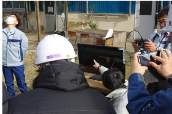
モニターでチェック