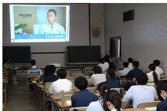
先輩社員インタビュー