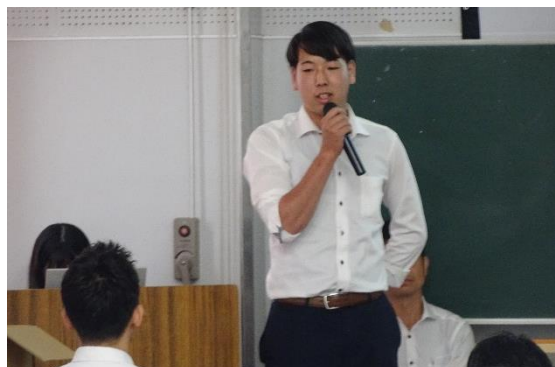
若手社員の話（卒業生）