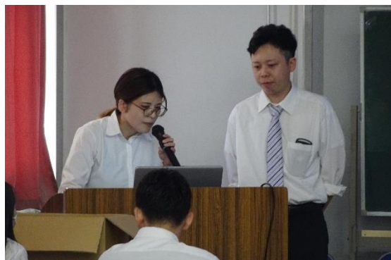
異業種からの転職、建設業で働く女性社員の話