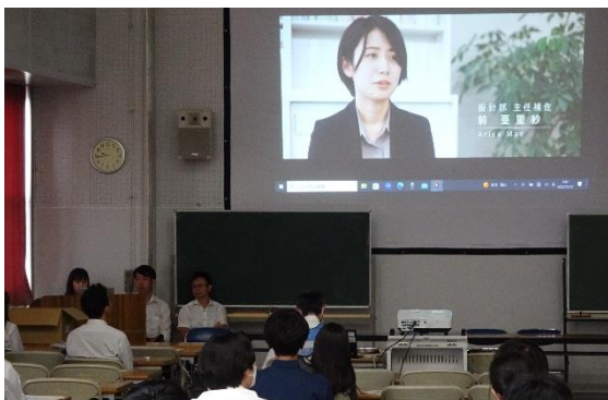
会社 PR 動画視聴