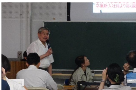
高卒と大卒の違いについて