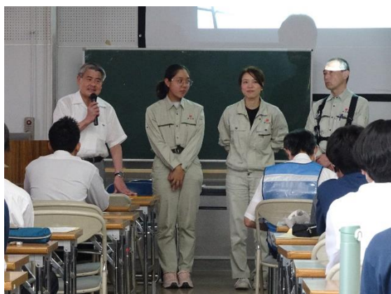
活躍する女性社員の紹介