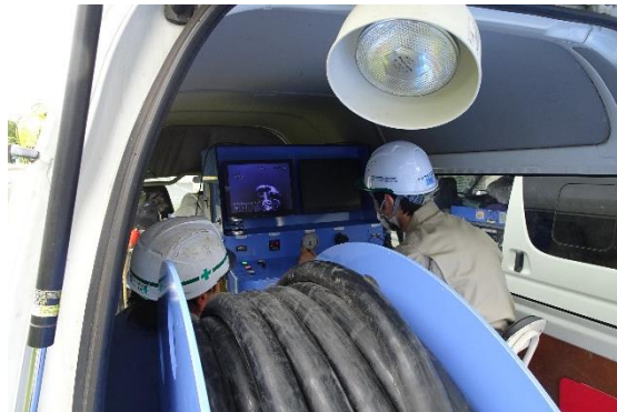
カメラ車から管内の様子をカメラで確認し削孔機を動かす