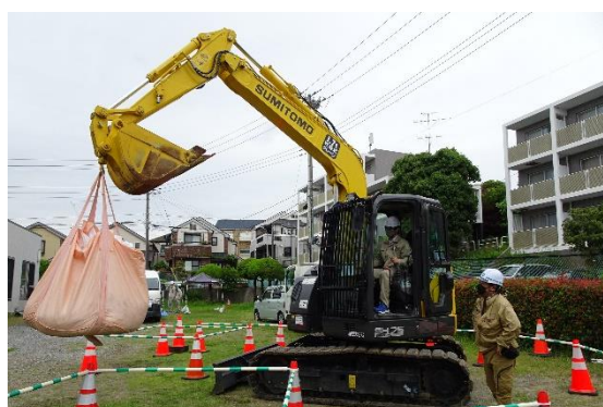
大型土のうの吊り上げ・移動体験