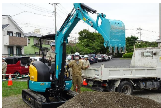
土砂の積み込み体験