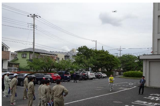
10m 飛行 (最高 149m)