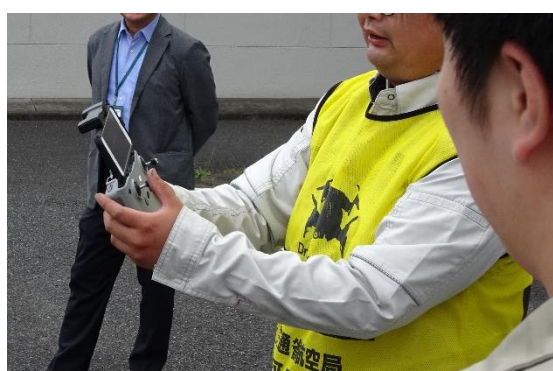
ドローン操作 / スマホで映像確認