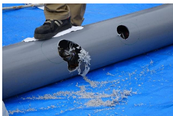
管内側から削孔機により穴を開ける