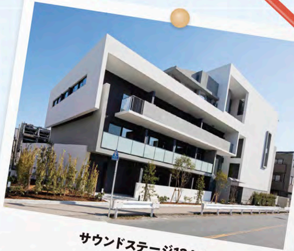
サウンドステージ1242 ジェクト株式会社

初めて責任を持つ立場で行った現場、大変なこともありましたが様々な新しいことが経験できました。職人さんとの仲も良くなり、竣工の際には前回の現場よりも成長したと感ずることができました。