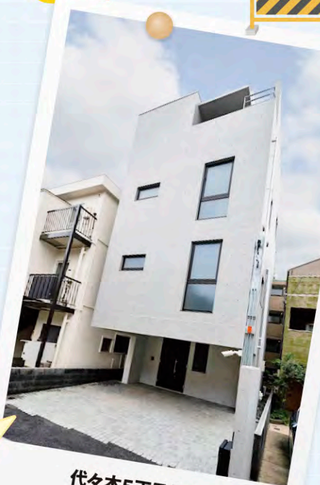
代々木5丁目住宅 露木建設株式会社