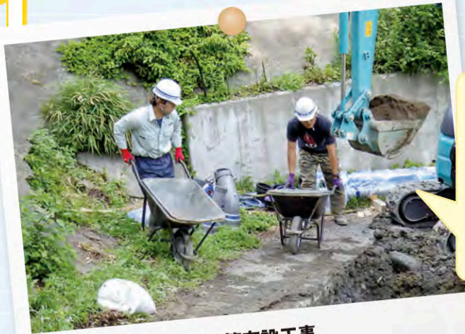
水道管布設工事 株式会社 いづみ工事

山の中に水道本管を布設する工事現場では、ダンプが入ることができず、手で運んだり、リース会社と相談して電動の台車などを活用して資材を運搬しました。重機が入れないので、手掘りしたり、一輪車を使って残土の運搬もしました。創意工夫が必要な現場だったのでとても印象深く、充実していたことを思い出します。