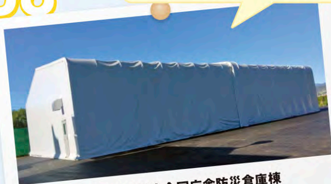
神奈川県足柄上合同庁舎防災倉庫棟 株式会社 下田組