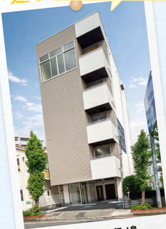
ストレージプラス江ノ島 株式会社 門倉組

この物件はかなり狭く高い建物で近隣や隣地の人達の協力を得なければ完成することが難しかったです。無事完成して隣地の人から新しいお仕事を依頼されました。