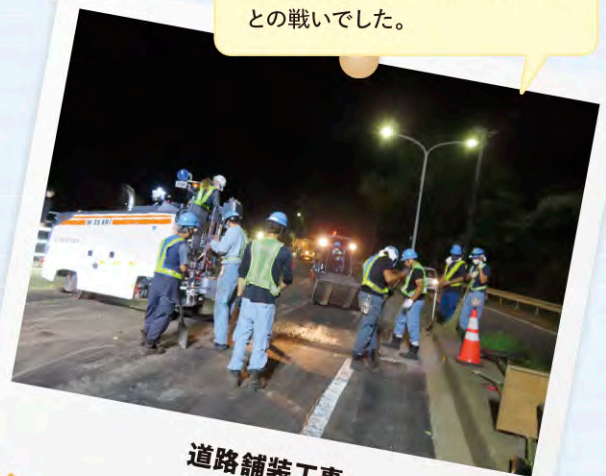
道路舗装工事 東建設株式会社

切削オーバーレイ工法を用いた道路の舗装工事です。日中の作業終了後の夜間作業。蒸し暑さとの戦いでした。