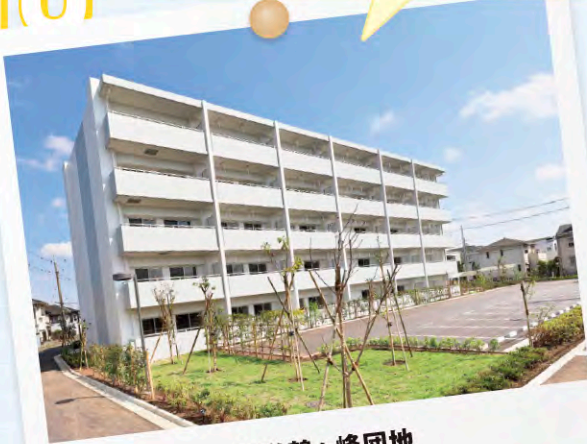
県営鶴ヶ峰団地 株式会社 紅梅組

入社して初めての配属先の現場です。自分が配属された頃は竣工間近で忙しいのにも関わらず、右も左も分からない私に、所長や先輩、職人さんが優しく1から教えてくださり多くのことを学びました。非常に感謝しております。