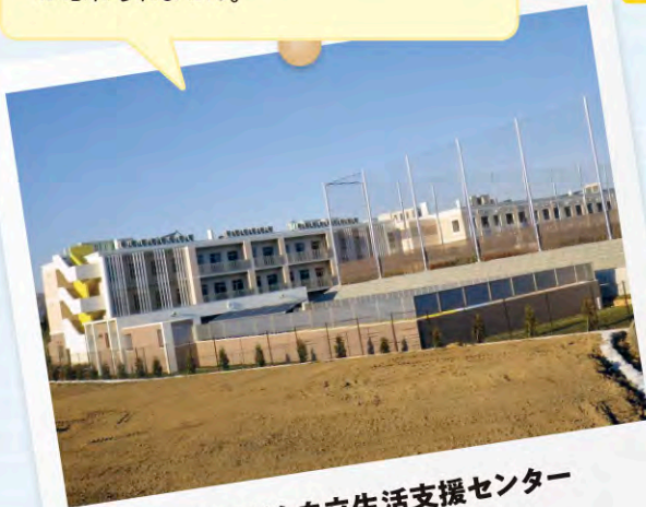
県立子ども自立生活支援センター 「きらり」新築工事 昭和建設株式会社

共同企業体で出向しました。その時はこんな大きな建物を自分がチャレンジさせてもらえることのワクワクその反面できるのかなという不安がありましたが、会社のアシストもあり無事に竣工したときの感動が忘れられません。