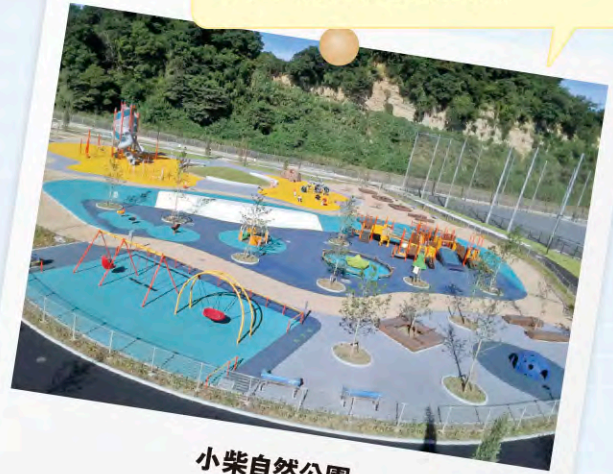
小柴自然公園 株式会社 泰山園

都市計画に係る公園の整備工事という一大事業に携わることができ、自分の人生の中でも大きな糧となりました。