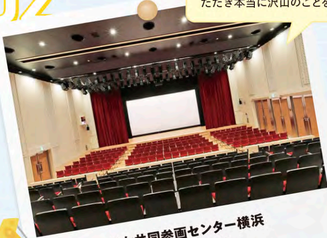
男女共同参画センター横浜 岡山建設株式会社

初めて現場監督として働いた現場で、色々な職人さんや工事関係者の方に優しくしていただいたり、丁寧に教えていただき本当に沢山のことを学びました。