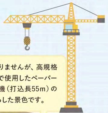
高規格堤防盛土工事 株式会社 鈴木組

建設物ではありませんが、高規格堤防盛土工事で使用したペーパードレーン打設機(打込長55m)の頂上から見下ろした景色です。