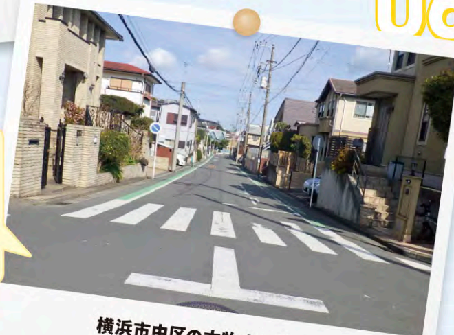
横浜市中区の本牧大里地区 株式会社 センチュリー工業