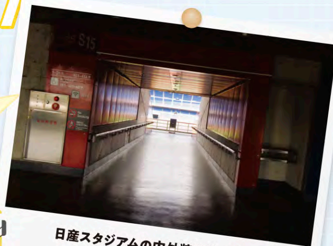
日産スタジアムの内外装改修工事 株式会社 安藤建設

会社の工事で建てた倉庫棟です。私は基礎工事にしか関わっていませんが、初めての大規模な基礎工事をやって大変さを感じたので思い出に残っています。