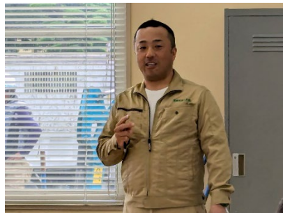
浜崎建設工業㈱濱崎社長