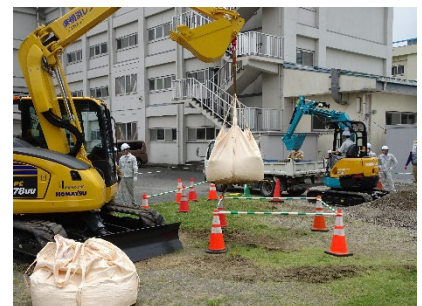
土砂の積み上げ体験やクレーン機能付きバックホウでの荷の吊り上げ体験