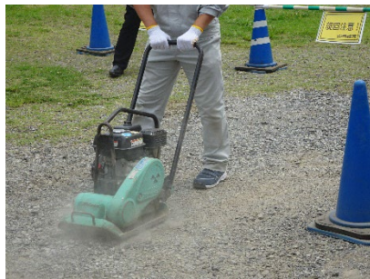
プレートコンパクター体験