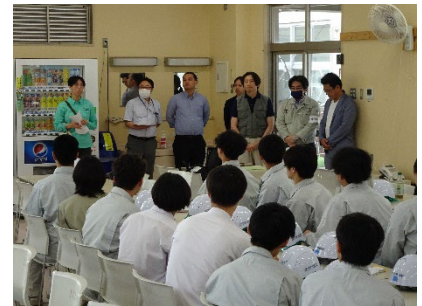
参加者企業の皆さん