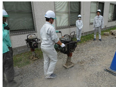
タンピングランマー体験